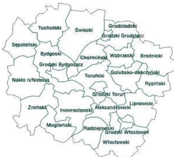
Mapa województwa kujawsko-Pomorskiego z podziałem na powiaty

Gmina Grudziądz położona jest w niecce Basenu Grudziądzkiego. Znaczna część leży nad Wisłą. Graniczy z gminami Rogóźno i Gruta od wschodu, Chełmno, Stolno i Radzyń Chełmiński od południa, od zachodu z gminą Dragacz a od północnej strony graniczy z województwem pomorskim.